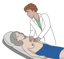
palpation des seins

Une mammographie est une radiographie des seins. Un manipulateur radio m'accompagne pour faire cet examen.